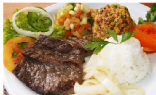
carne do sol